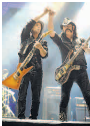
Geniales Saiten-Duo: Phil Campbell (l.) und Lemmy (r.)